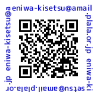
eniwa-kisetsu@amail.plala.or.jp 恵庭市通年雇用促進協議会 E-mail