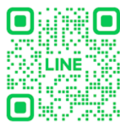
恵庭市通年雇用促進協議会 LINE 公式アカウント