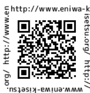
http://www.eniwa-kisetsu.org/ 恵庭市通年雇用促進協議会 公式ホームページ URL