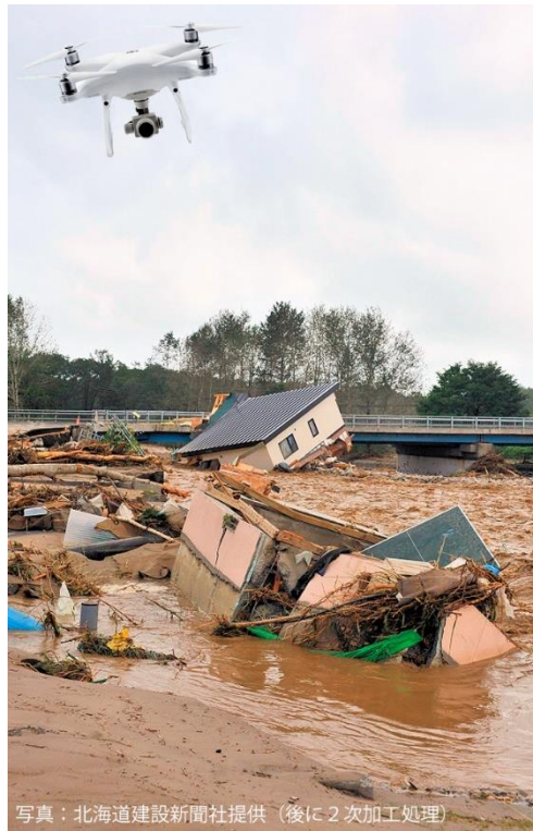
写真：北海道建設新聞社提供（後に2次加工処理）