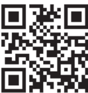
えにわ通年雇用 Web サイト (QR)