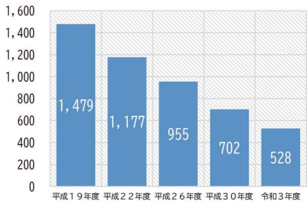
恵庭市内の季節労働者数の推移